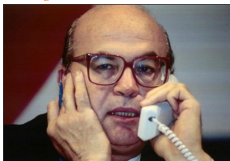
Bettino Craxi (1934-2000)